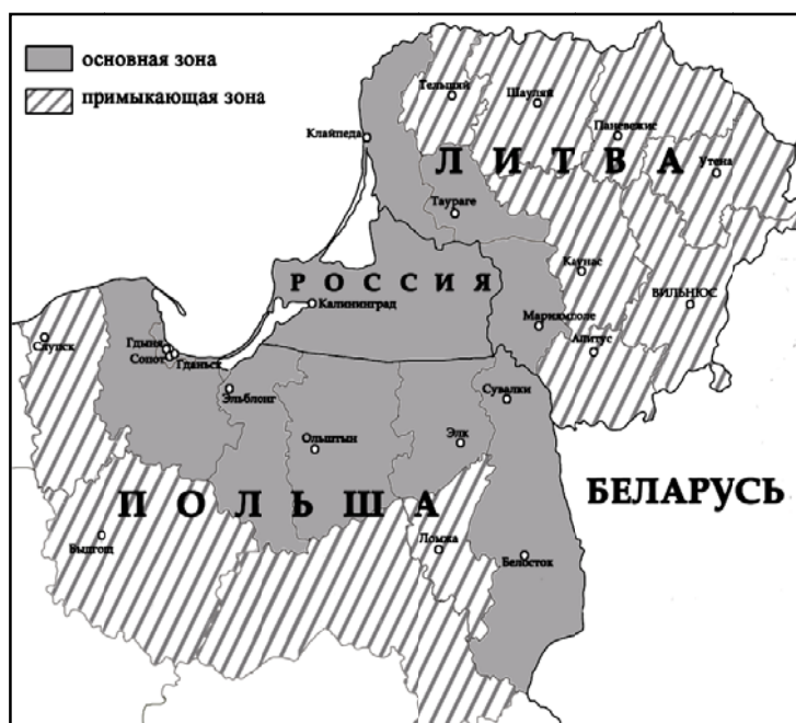
Рис. 4. Регион Программы соседства Литва — Польша — Россия