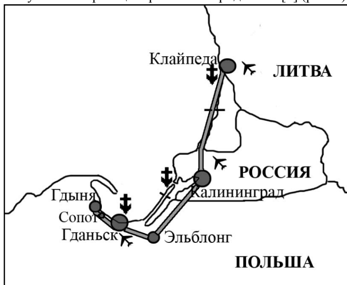
Рис. 1. Трехполярная система Трехградье (Польша) — Калининград (Россия) — Клайпеда (Литва)

В тех случаях, когда трансграничные регионы расположены между регионами-ядрами соседних стран, они могут становиться своеобразными регионами-коридорами развития, дополняя известную классификацию регионов Фридманна [6] (рис. 2).